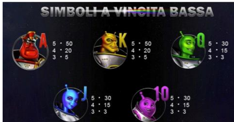
TABELLA DEI PAGAMENTI