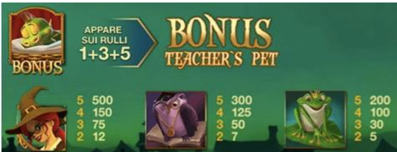
TABELLA DEI PAGAMENTI