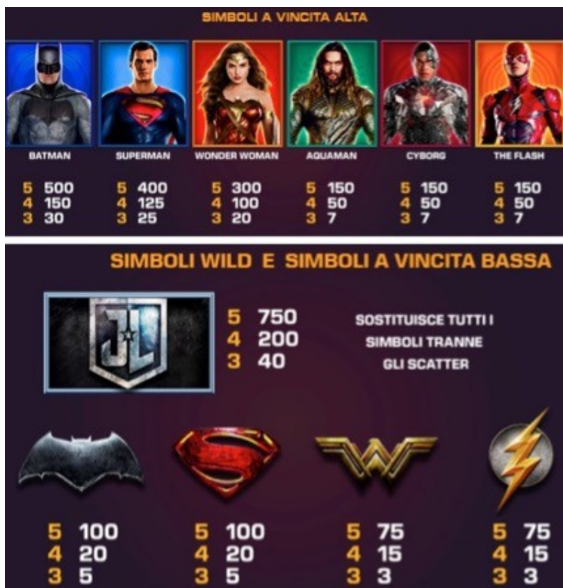
TABELLA DEI PAGAMENTI