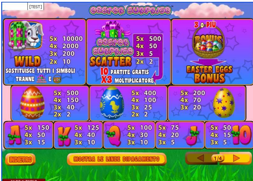
TABELLA DEI PAGAMENTI

Alla fine della partita bonus, una schermata mostrerà il totale delle vincite. Cliccare su Continua per tornare alle ruote della slot regolare.