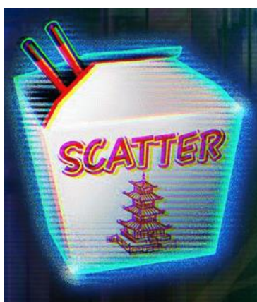
Simbolo Scatter Take-Out Box

The Take-out Box is the SCATTER symbol in the game.