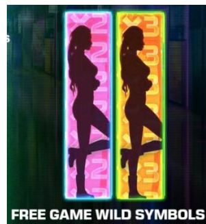
Simbolo Wild Speciale

Questo gioco dispone di 2 simboli WILD : il simbolo WILD della partita principale e il simbolo WILD delle Partite Gratis.