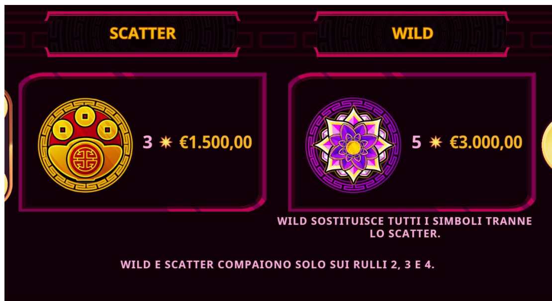
Figura 2 tabella dei pagamenti 1

Fai clic sull'icona X per lasciare le pagine delle Info e tornare al gioco.