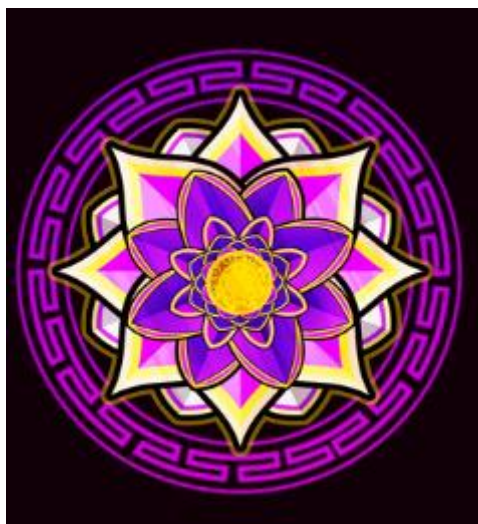
Figura 7 Simbolo Wild

Il simbolo su cui è presente la parola 'Wild' è il simbolo WILD del gioco.