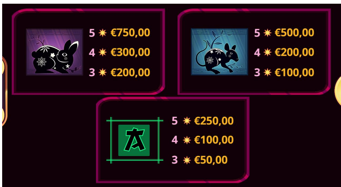
figura 4 Tabella dei pagamenti 3