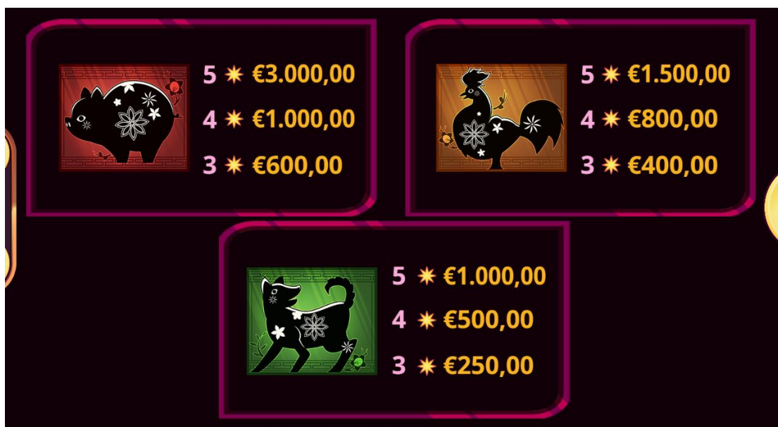
Figura 3 Tabella dei pagamenti 2