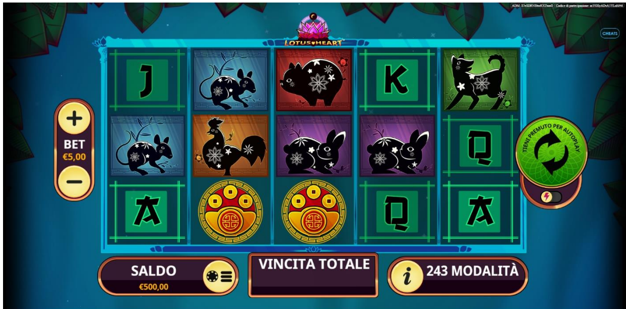
Figura 1 Schermata principale

Slot con 243 modalità di vincita, lo scopo di LOTUS HEART è quello di ottenere combinazioni di simboli vincenti, facendo girare i rulli.