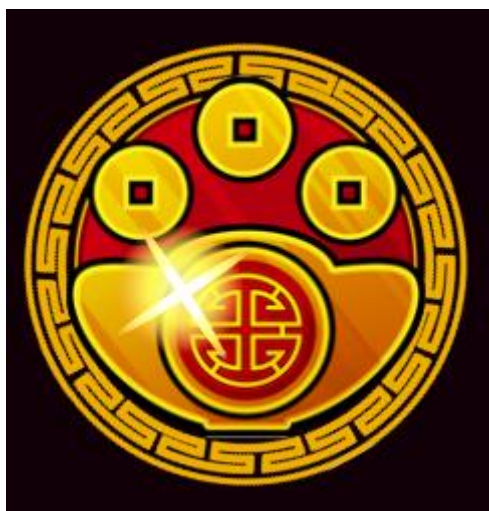
Figura 6 Simbolo Scatter Tridente