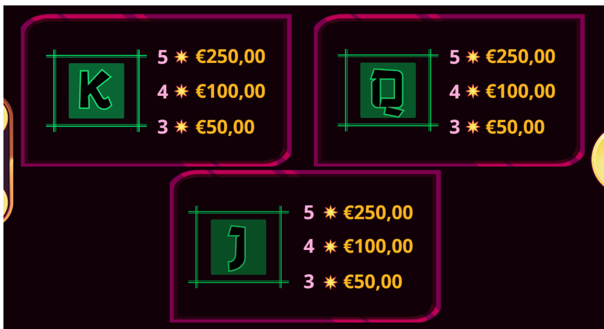
Figura 5 Tabella dei pagamenti 4