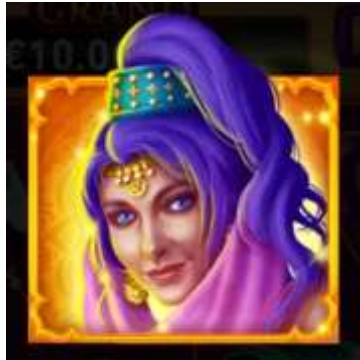
Figura 3 Simbolo Wild Genio

Il simbolo Wild è rappresentato dal Genio . Il simbolo Wild può sostituire qualsiasi altro simbolo, ad eccezione dei simboli Scatter e Luna , per ottenere la migliore combinazione possibile.