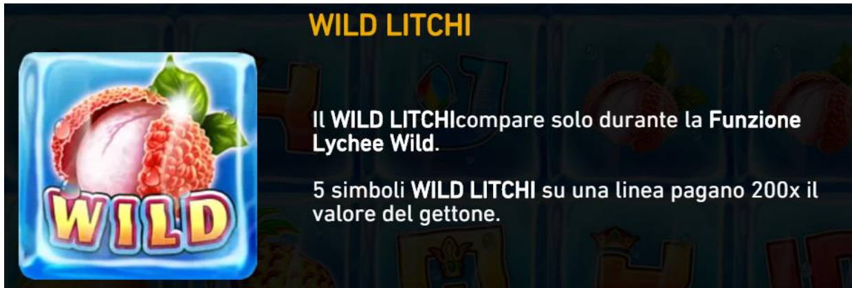
Figura 5 Simbolo Wild

Il Wild Litchi può comparire solo quando è attiva la funzione Lychee Wild .