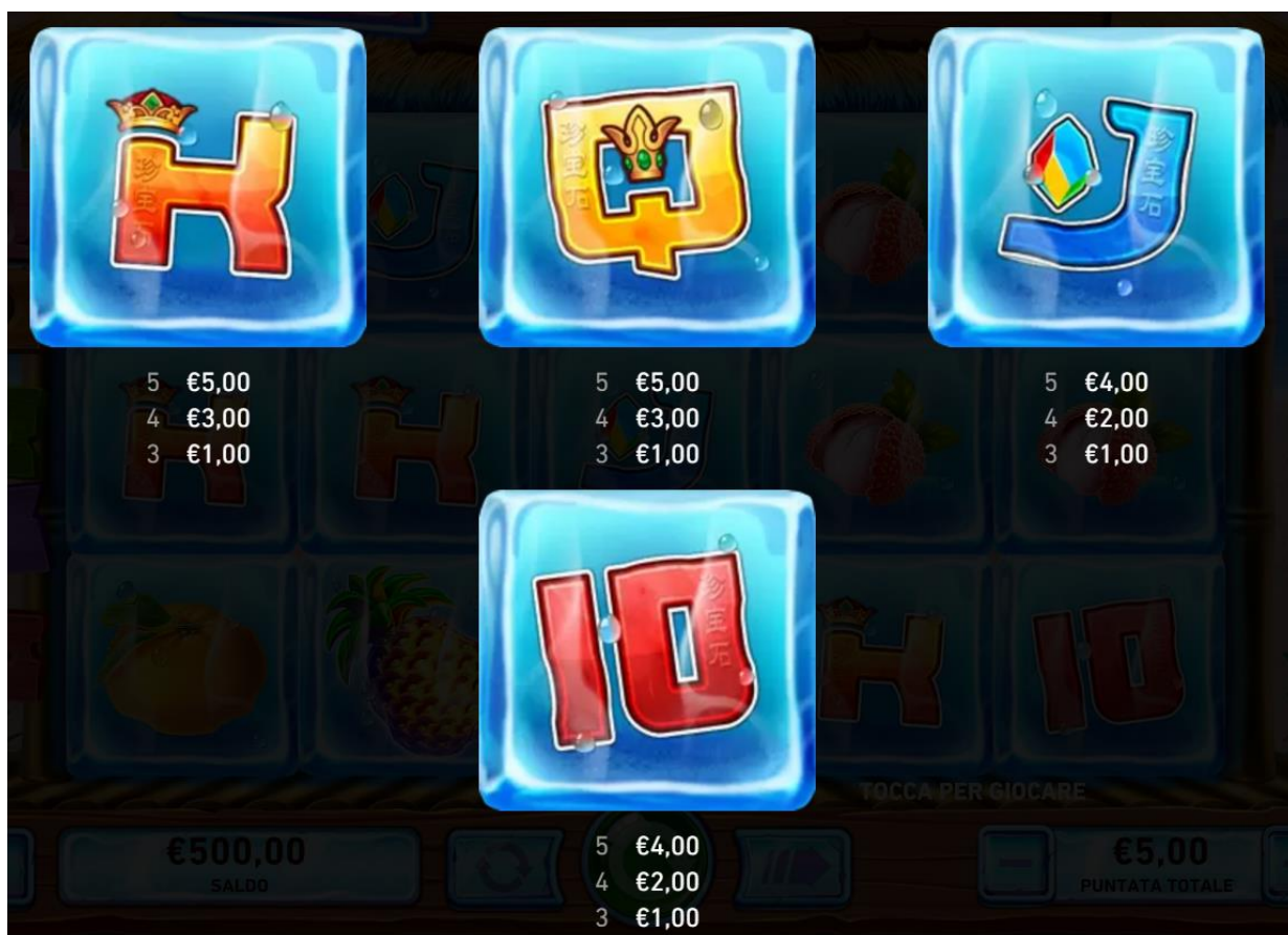
figura 4 tabella dei pagamenti 3