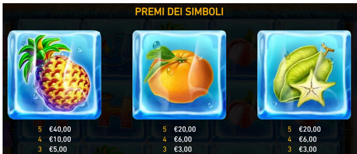
Figura 2 tabella dei pagamenti 1

Fai clic sull'icona X per lasciare le pagine delle Info e tornare al gioco.