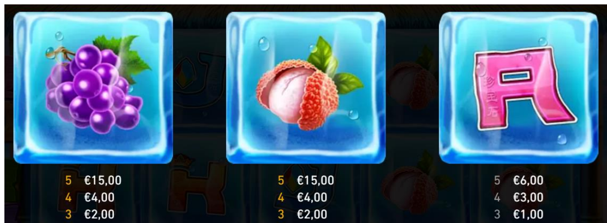
Figura 3 tabella dei pagamenti 2