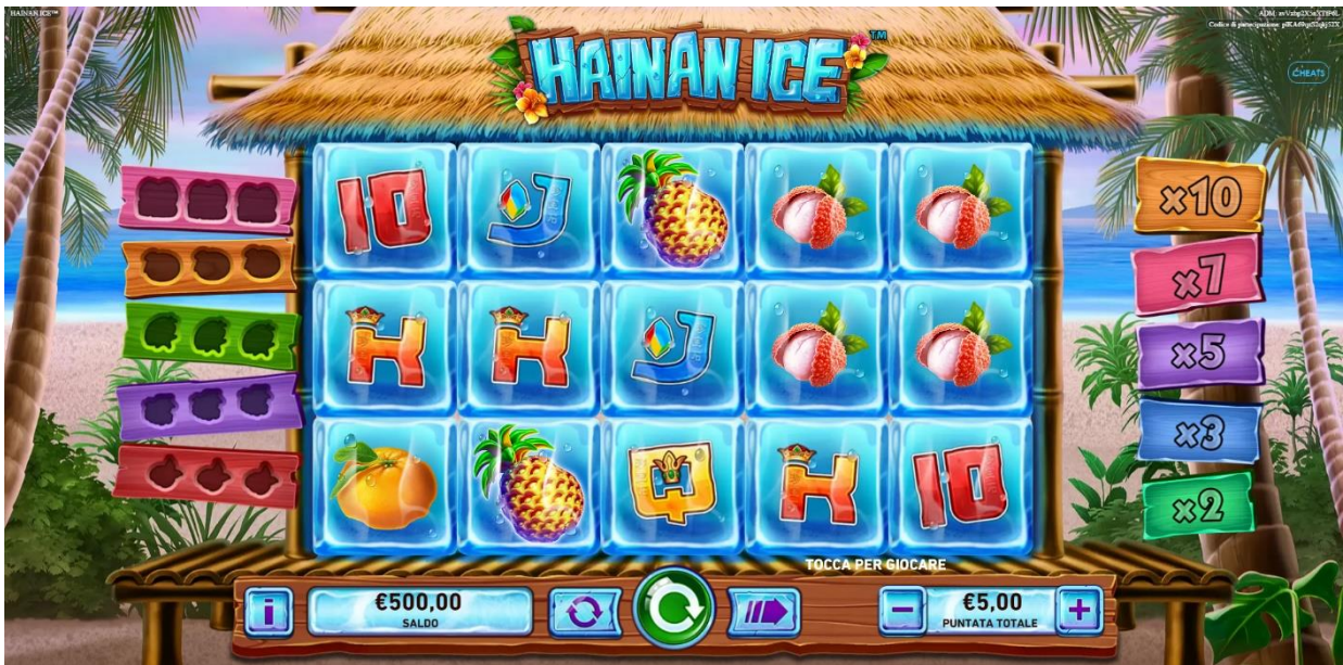
Figura 1 Schermata principale

Slot a 5 rulli e 25 linee , lo scopo di HAINAN ICE è quello di ottenere combinazioni di simboli vincenti, facendo girare i rulli.