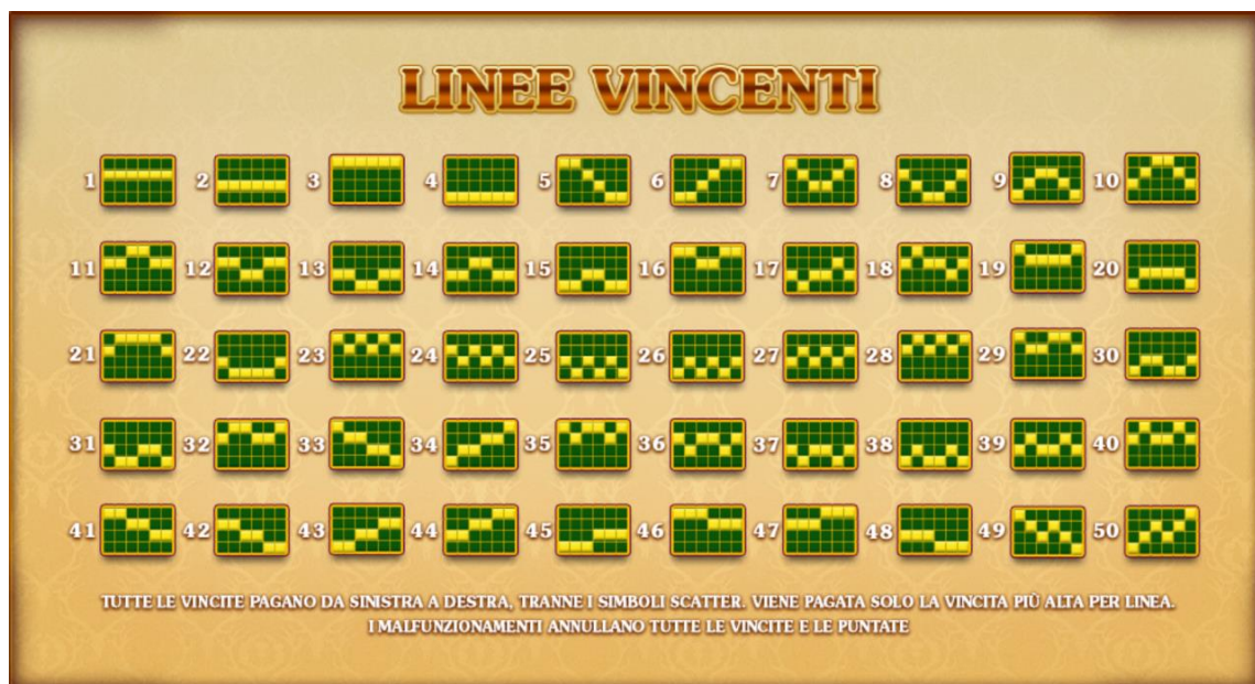
Figura 3 LINEE DI VINCITA

Tutte le 50 Linee di vincita sono sempre attive e possono essere visualizzate nella pagina corrispondente della schermata delle Info.