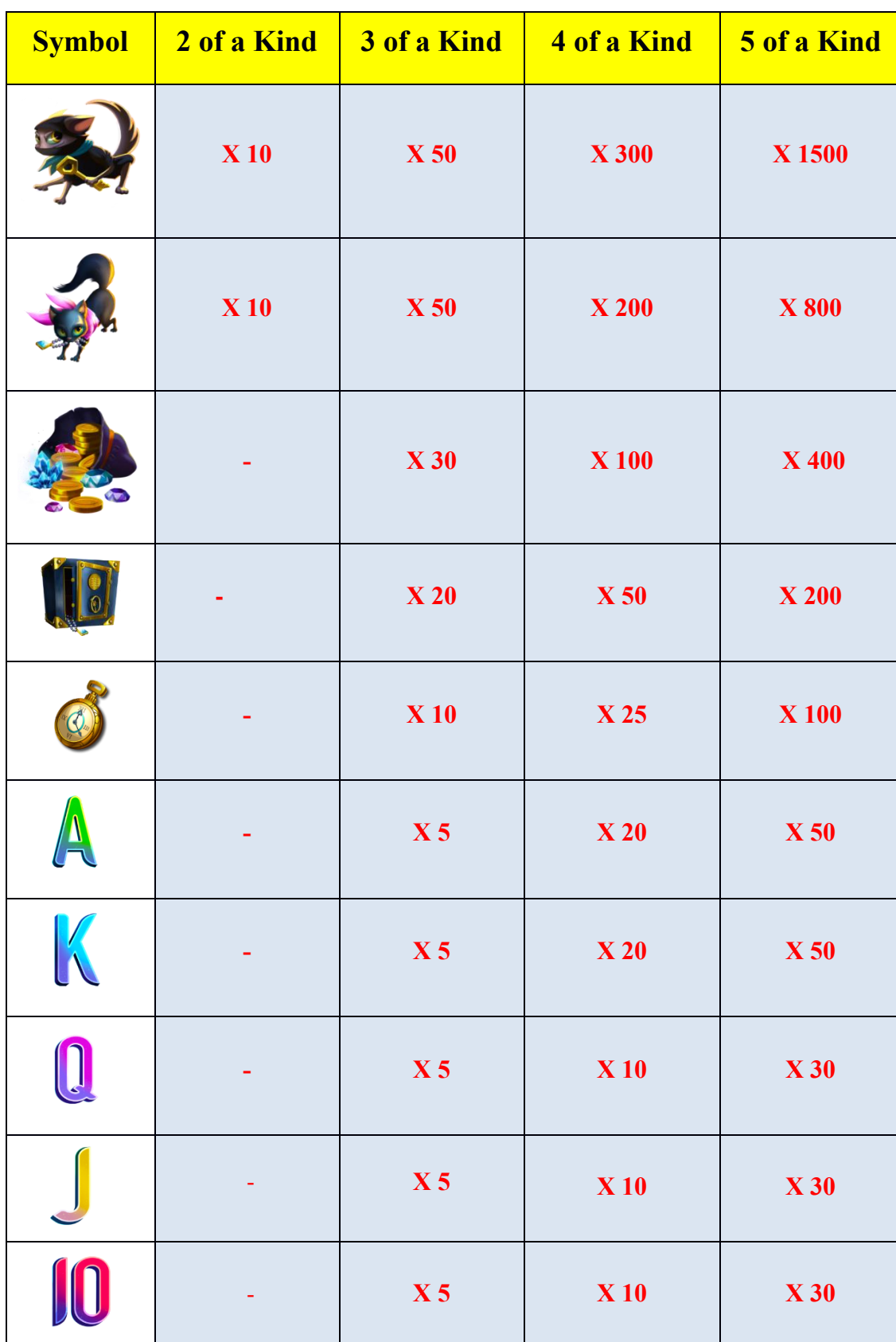
TABELLA DI PAGAMENTO

Tutte le vincite in tabella sono moltiplicate per il bet di linea: