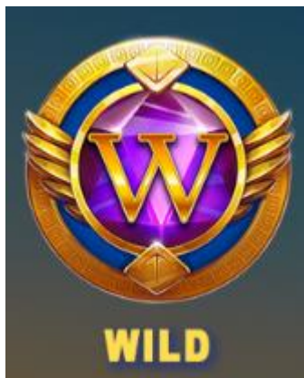
Figure 1 Simbolo Libro

Il simbolo WILD del gioco è la lettera W.