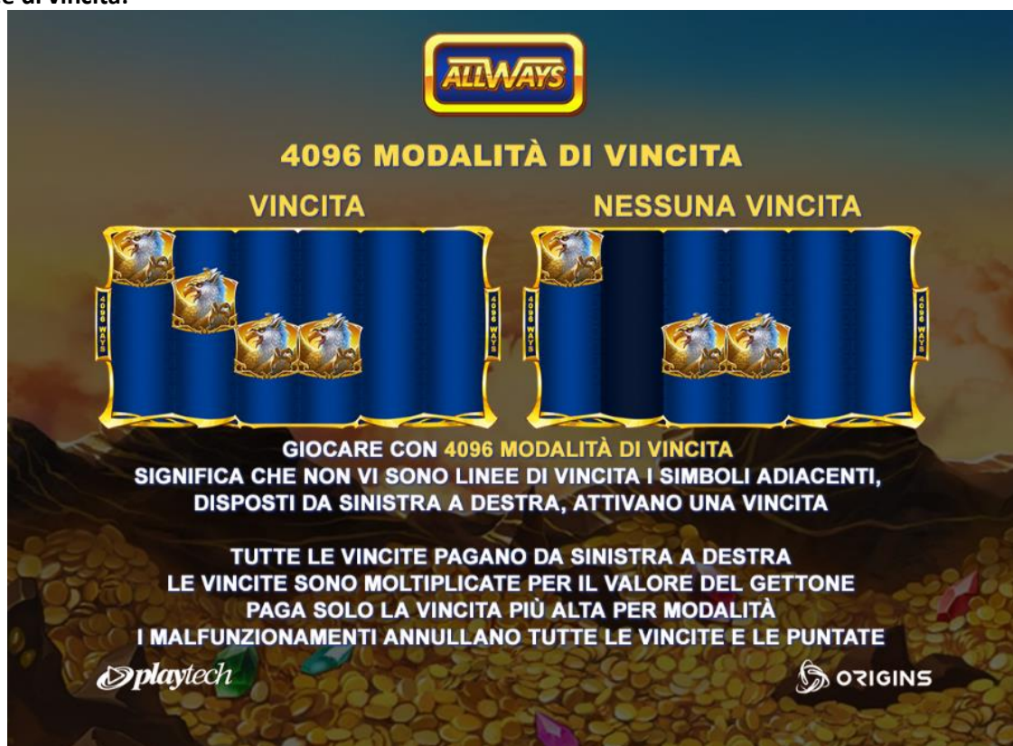
Figura 1 Linee di vincita

Le linee attive sono indicate da cornici che compaiono sulle posizioni dei simboli di ogni rullo, come illustrato nella tabella dei pagamenti.