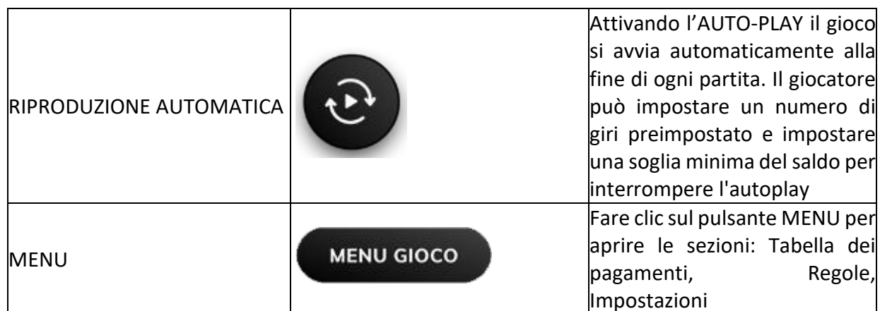
Tabella dei pagamenti

Tutte le vincite vengono assegnate moltiplicando l'importo della scommessa per il moltiplicatore.