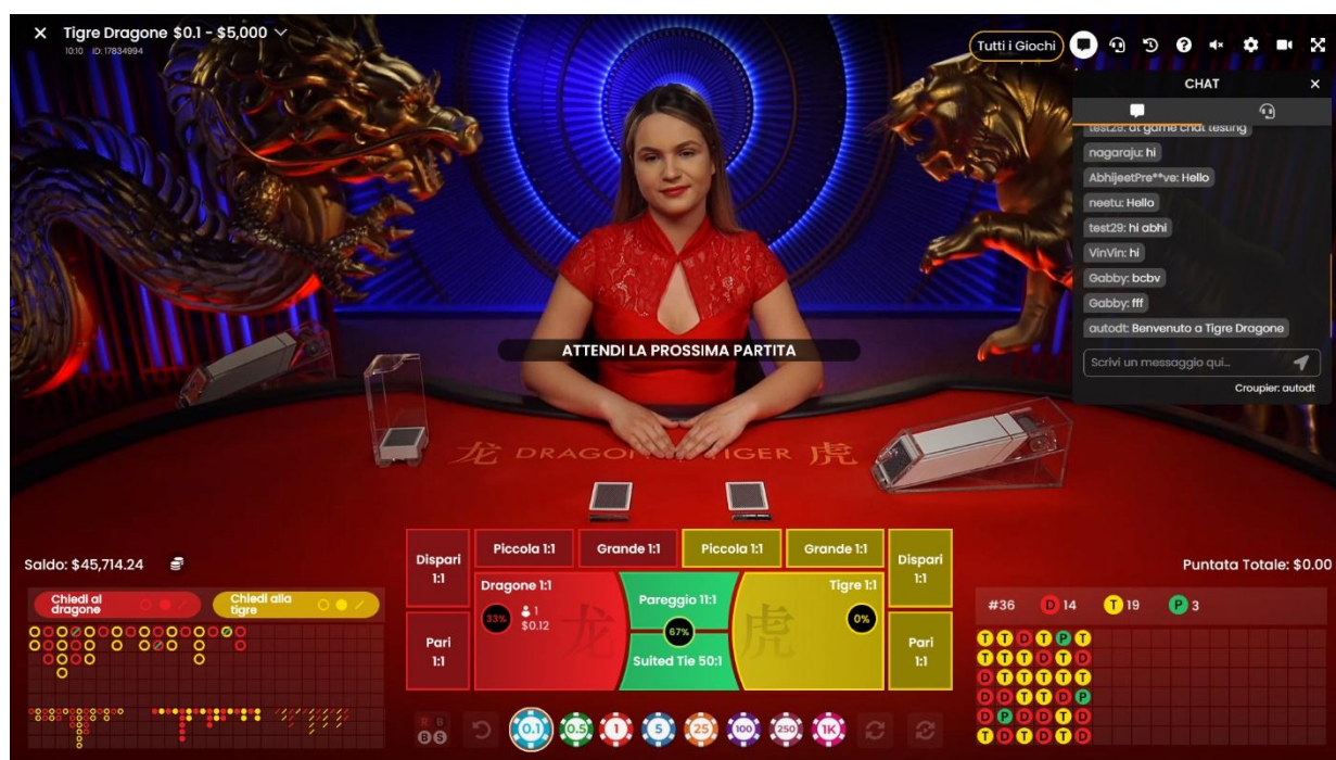
Figura 1 Schermata principale

L'obiettivo del gioco è prevedere quale mano ha la carta più alta, Dragon o Tiger. Non ci sono carte aggiuntive pescate nel gioco.